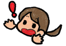
小学生・中学生・高校生の水難事故データ（県民のみ、月別、曜日別、H23～R2）