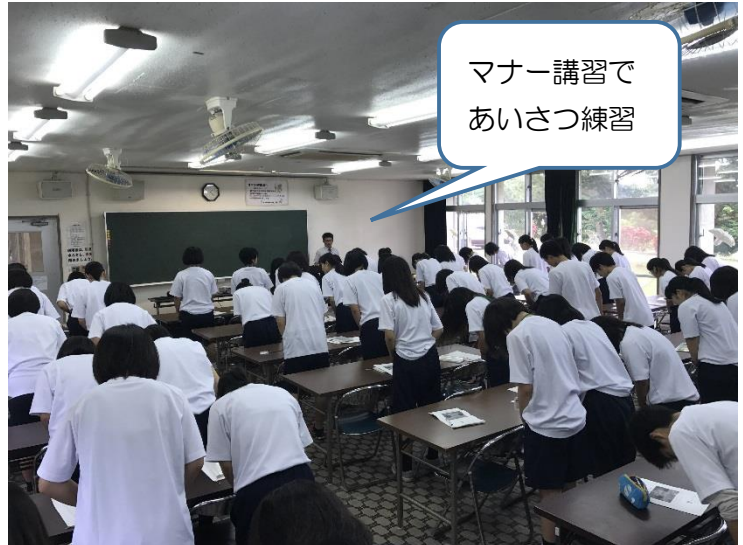
マナー講習で あいさつ練習