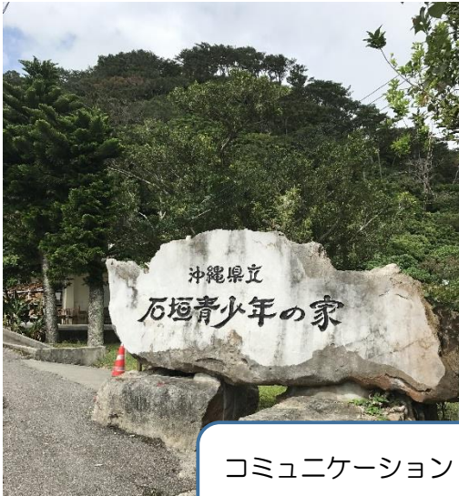
コミュニケーション トレーニング