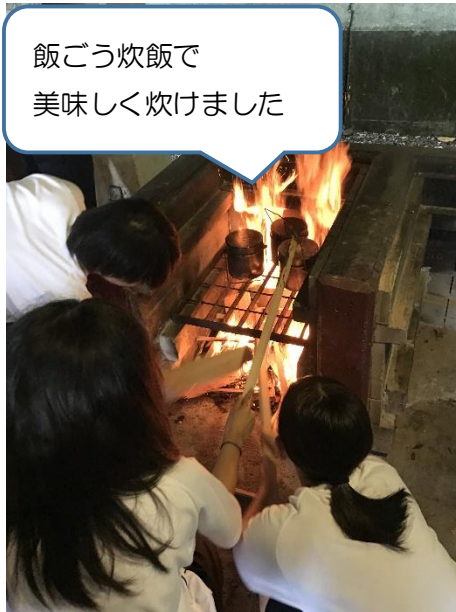
飯ごう炊飯で 美味しく炊けました