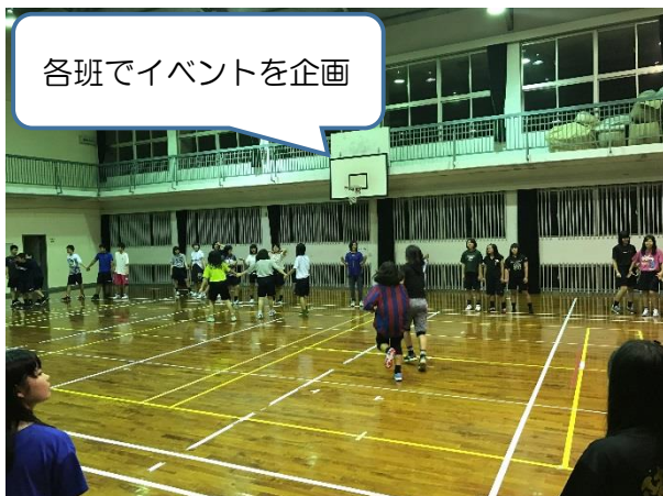
各班でイベントを企画