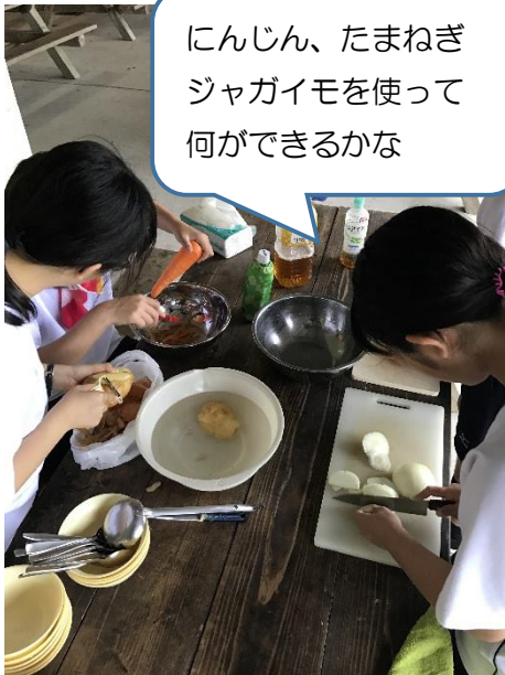
にんじん、たまねぎ ジャガイモを使って 何ができるかな